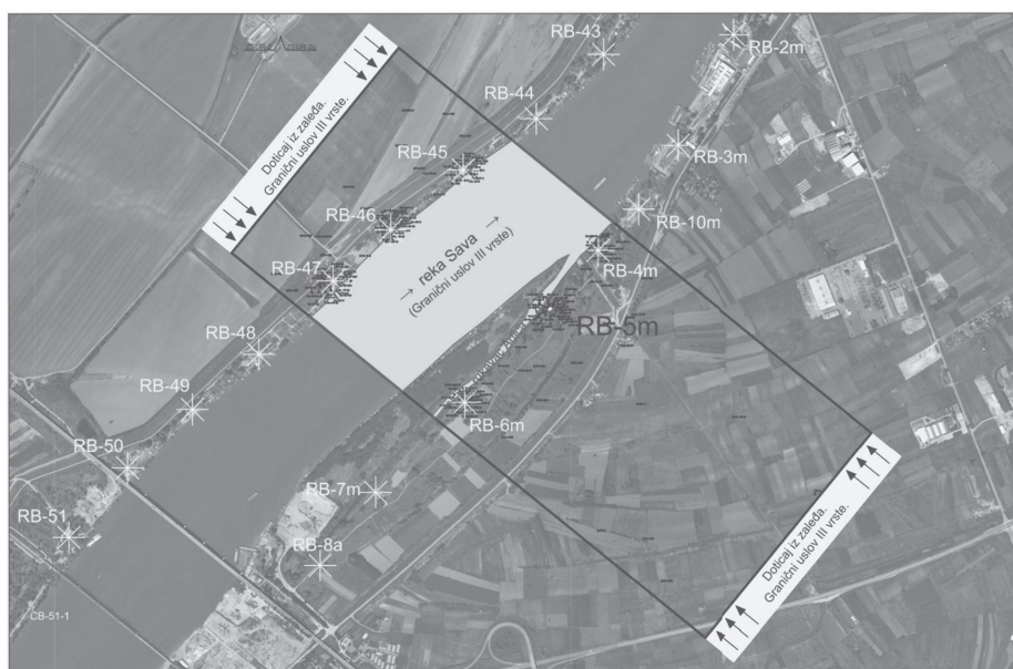
Slika 1. Granice 3D konceptualnog modela sa položajem bunara i istražnih bušotina korišćenih u šematizaciji izdani i graničnim uslovima (na osnovu Božović et al., 2020).

Drugi aspekt koji je potrebno razmotriti prilikom definisanja veličine prostora modela se odnosi na režim nivoa izdani u zaleđu bunara, čije poznavanje je zasnovano na podacima osmatranja nivoa podzemnih voda u pijezometrima u bližem i daljem zaleđu bunarskog niza i reke. Na slici 1 je predstavljen prostor konceptualnog modela izrađenog za potrebe analize bunara sa horizontalnim drenovima RB–5m.